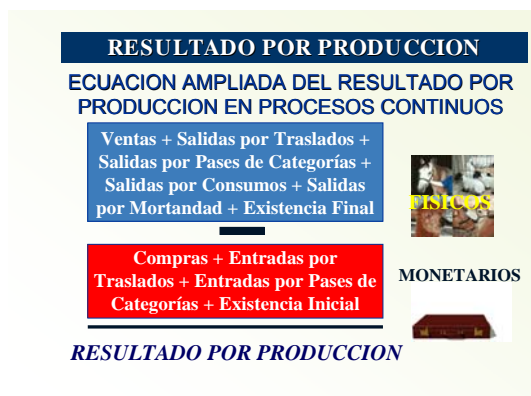
Cuadro No 12: Resultado por Producción