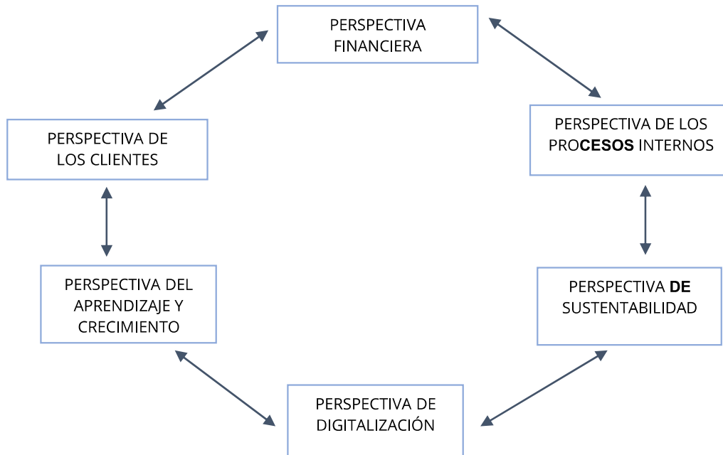
Gráfico 4. Propuesta de esquema de las 6 perspectivas.